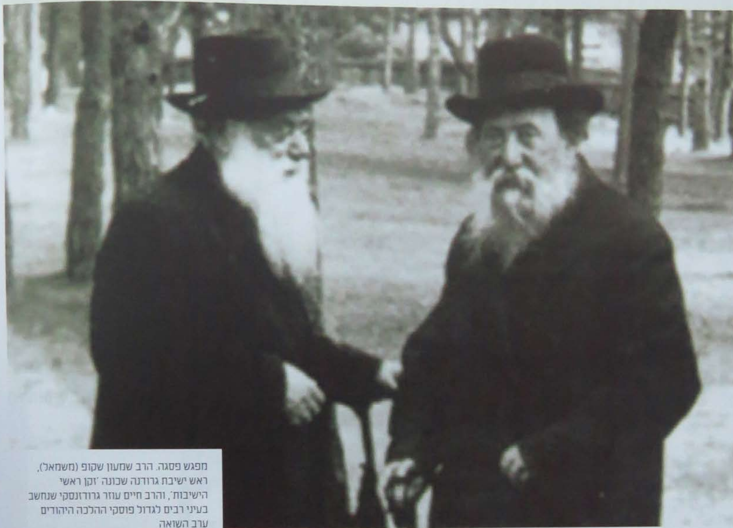
מפגש פסגה: הרב שמעון שקופ (משמאל), ראש ישיבת גרודנה שכונה 'זקן ראשי הישיבות', והרב חיים עוזר גרודזנסקי שנחשב בעיני רבים לגדול פוסקי ההלכה היהודים ערב השואה